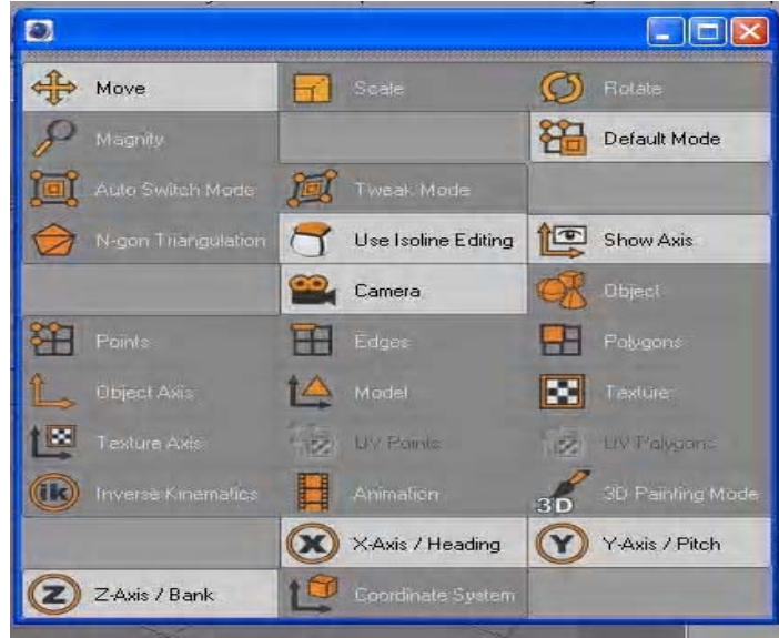
شكل رقم ١١

وهى مجموعة أدوات التحريك والدوران وباقى أدوات الموديلينج ويمكن الوصول إليها من شريط الأدوات مباشرة